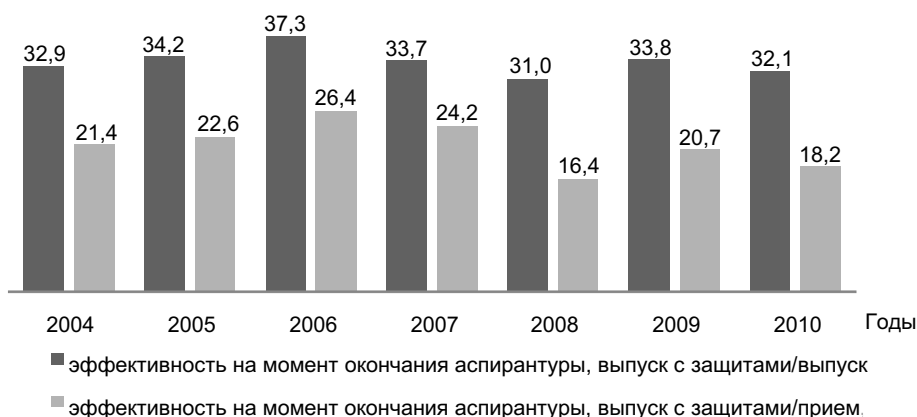
Рис. 3. Динамика показателя эффективности деятельности системы аспирантуры для подведомственных вузов Минобрнауки России (2004–2010 гг.), %

Как видно из рис. 4, наибольший вклад в увеличение показателя эффективности вносят за-